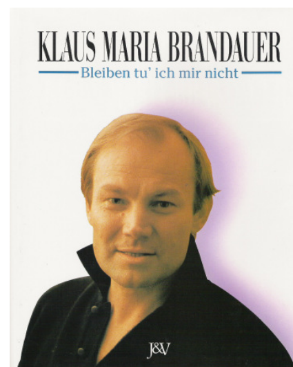
In Stralsund vor einem begeisterten Publikum gelesen: „Bleiben tu´ich mir treu“

Was ist es eigentlich für ein Gefühl, einen „Oscar“ - Filmpreis in den Händen zu halten?